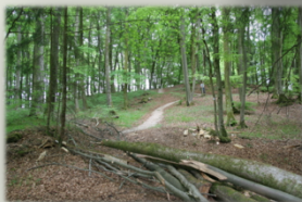
Krausbuchen 1, 2 und 3