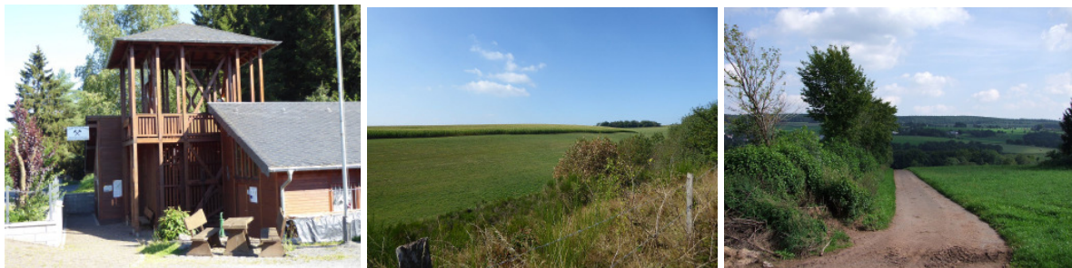
Besucherbergwerk Mühlenberger Stollen, Panoramablicke, Fotoarchiv Tourist-Information Prümer Land

Ausgangspunkt: 54608 Bleialf, Hamburg 1, Eingang Mühlenbergerstollen, Wanderparkplatz